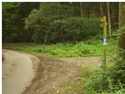
Blaue Route in Höhe des Zoo - in Nähe des Affengehege