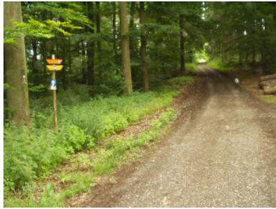
Blaue Route am Limeswegweiser