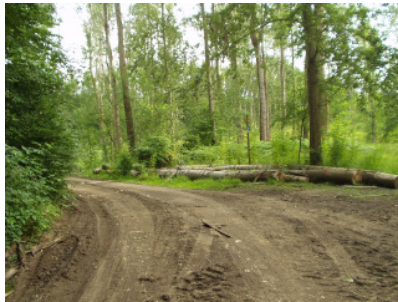
Blaue Route Höhe Antonskreuz