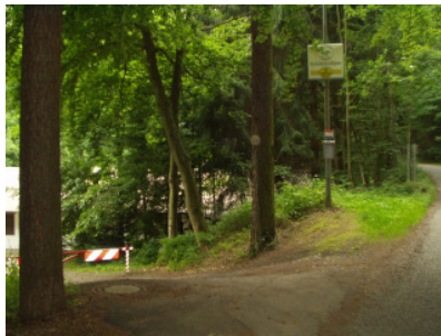
Blaue Route in Höhe Schützhaus