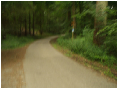
Blaue Route oberhalb Vogelpfad