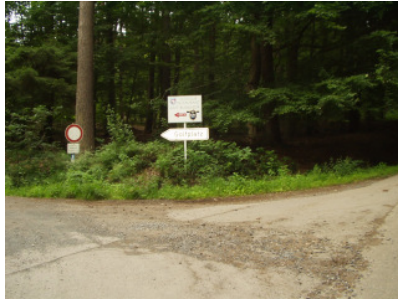
Blaue Route Einfahrt Golfplatz