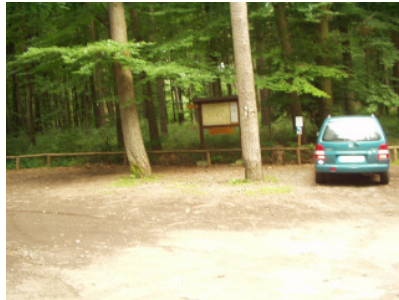
Blaue Route Parkplatz Antonskreuz