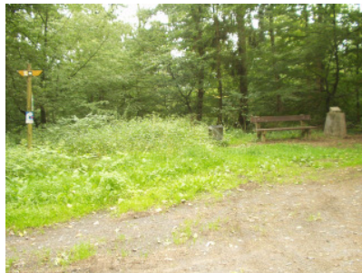
Blaue Route an der Jahneiche