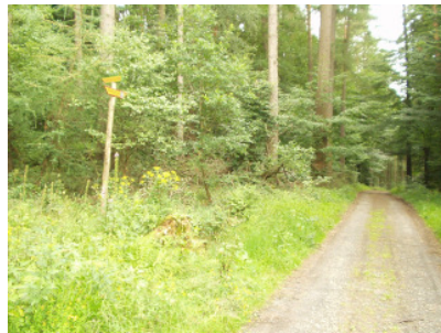
Blaue Route am Limes "Am Harmorgenberg"