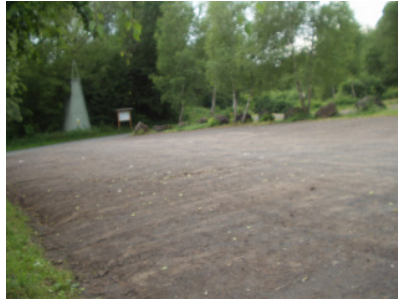
Blick zurück Trafostation Starttafel Zooparkplatz